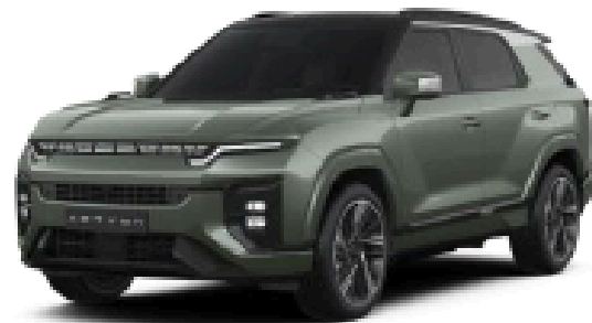
Forest Green (2GO)*